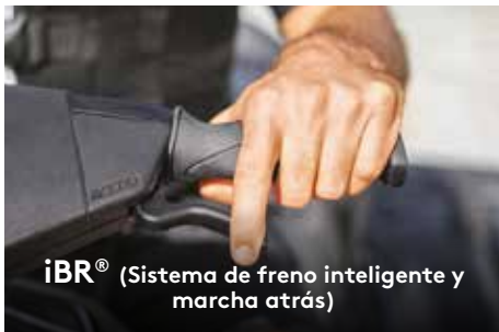
iBR® (Sistema de freno inteligente y marcha atrás)

El exclusivo sistema iBR® de Sea-Doo® detiene la moto acuática más rápido y ofrece mayor control y maniobrabilidad a bajas velocidades y en reversa.