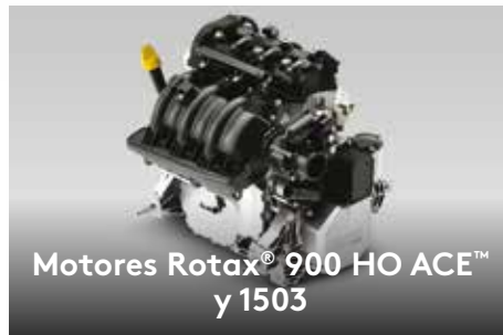
Motores Rotax® 900 HO ACE™ y 1503

El exclusivo sistema iBR® de Sea-Doo® detiene la moto acuática más rápido y ofrece mayor control y maniobrabilidad a bajas velocidades y en reversa.