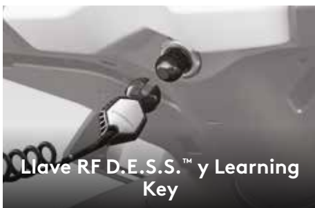
Llave RF D.E.S.S.™ y Learning Key

Capacidad de almacenamiento de 110 L (29 US gal.) que permite guardar artículos importantes durante la conducción. 1