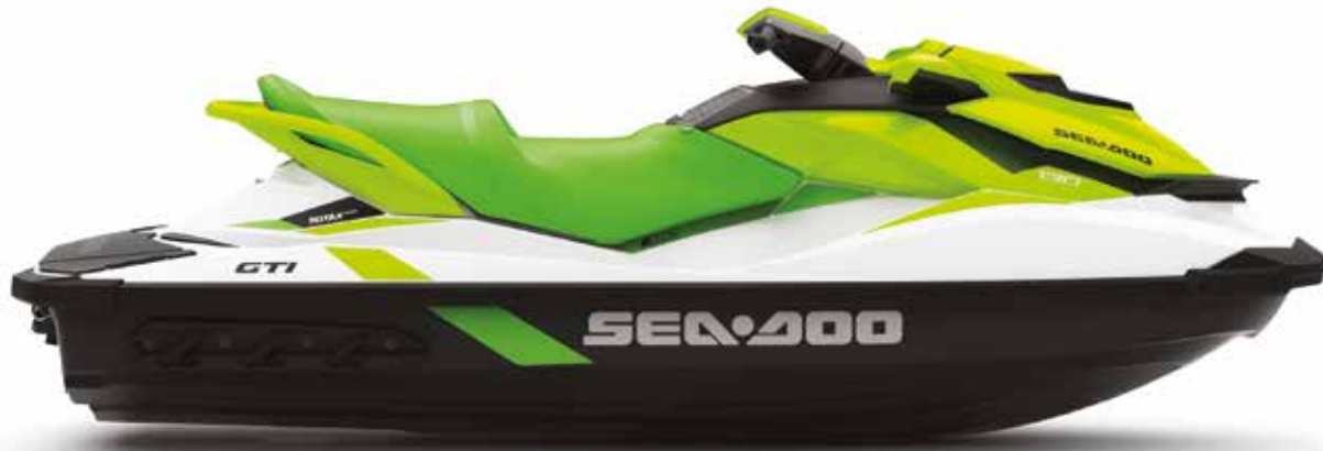
Se muestra GTI 130