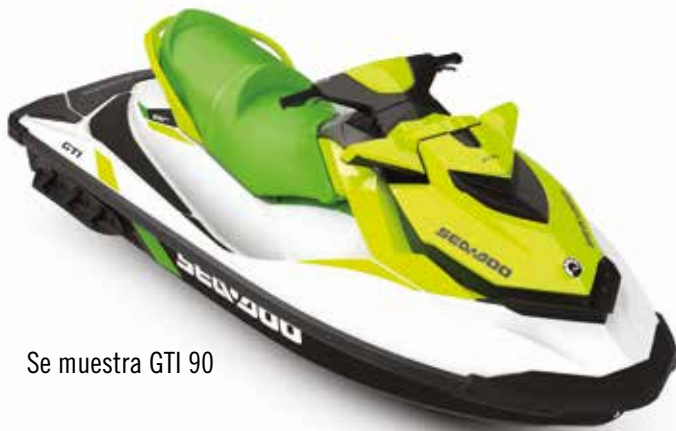
Se muestra GTI 90